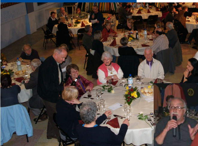
Souper débat 2009